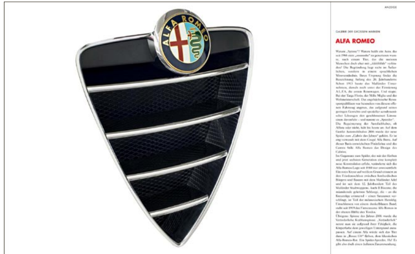
Beispiel: Alfa Romeo