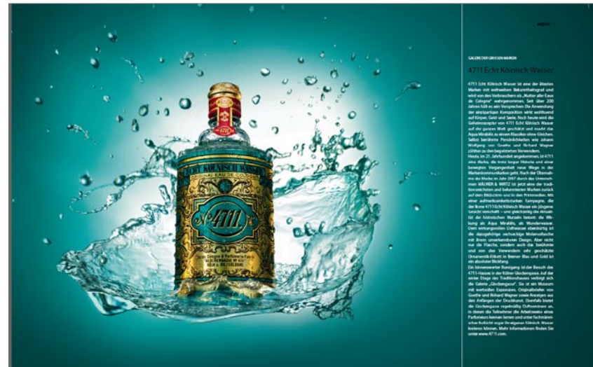
Beispiel: 4711 Eau Kölnisch Wasser